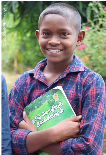
Kinder bekommen mehr Selbstvertrauen, wenn sie lesen lernen.

Alphabetisierungskurse für Kinder und Jugendliche