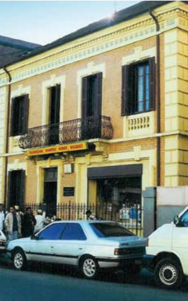
Das Bibelhaus in Antananarivo.

Vier Depots, drei Bibelausgaben, über zwei Millionen verbreitete Bibeln, 22 Generalversammlungen. Ein Jahr vor ihrem 45. Jubiläum blickt die Madagassische Bibelgesellschaft mit Dankbarkeit auf ihre facettenreichen Tätigkeiten zurück.