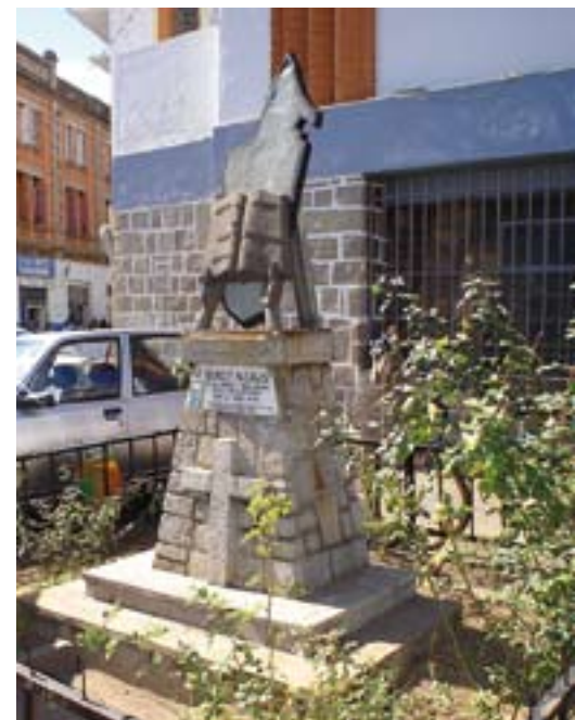
Denkmal, das an die Fertigstellung der ersten Bibel in Madagassisch im Jahr 1835 erinnert.