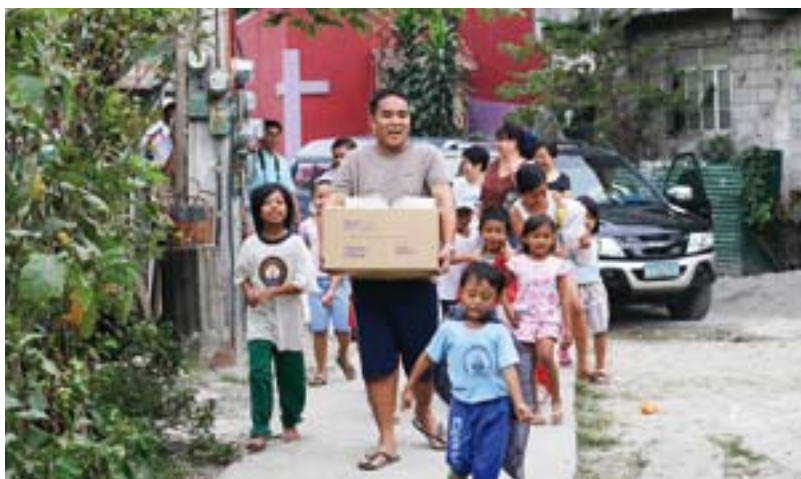
«Damit sie alle eins seien»: Grosse Freude über die Ankunft des Bibelpakets in einem Armenviertel auf den Philippinen.