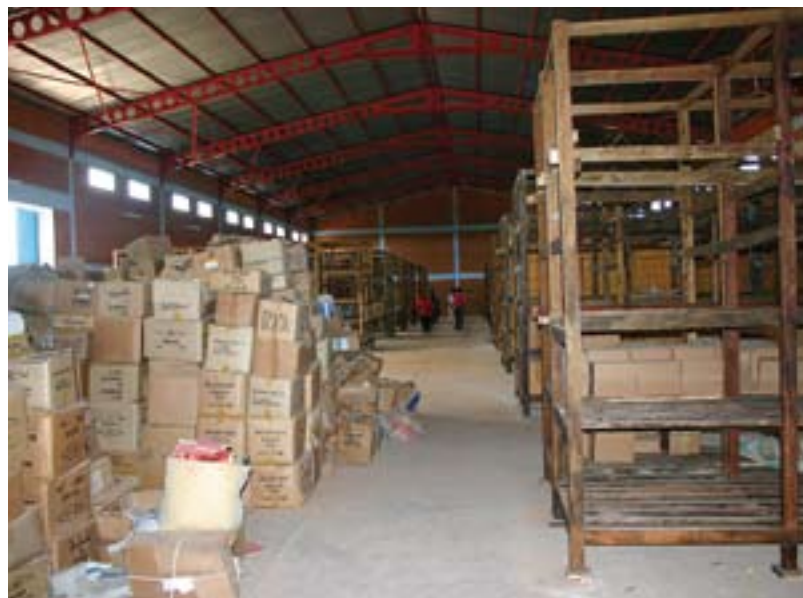
Ein Bibeldepot der FMBM.

Die Kosten eines Bibeldepots belaufen sich auf umgerechnet CHF 113 000.– (EUR 74 300.–). Mit drei Vollzeitstellen dient es im Durchschnitt zwei bis drei Millionen Menschen.