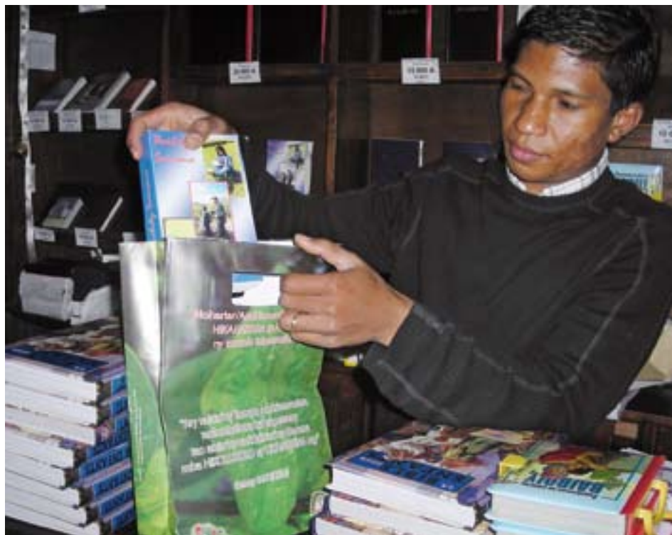
Verkäufer beim Einpacken in einen umweltfreundlichen Papiersack.

Mit dem zweiten, gleichermassen wichtigen Projekt will die FMBM auf das dringliche Bedürfnis der Bevölkerung, das