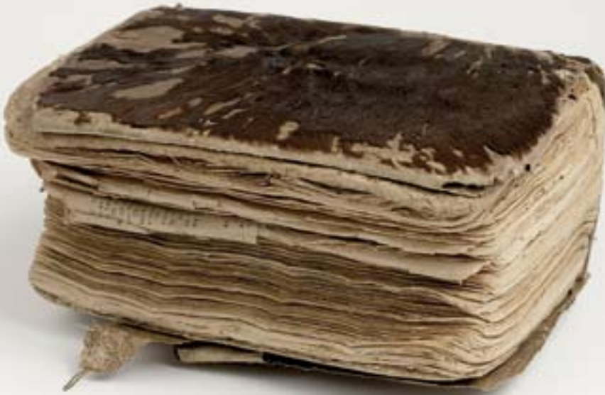
Eine der Bibeln, die während der grossen Verfolgung in der Erde vergraben wurde.

Die Begeisterung für die Bibel in ihrer Muttersprache haben viele madagassische Christen mit ihrem Leben bezahlt. Im Buch «Histoire de la Bible en France et fragments relatifs à l'histoire générale de la Bible» 1 berichtet Daniel Lortsch auch über die Verfolgungen. Eine Zusammenfassung.