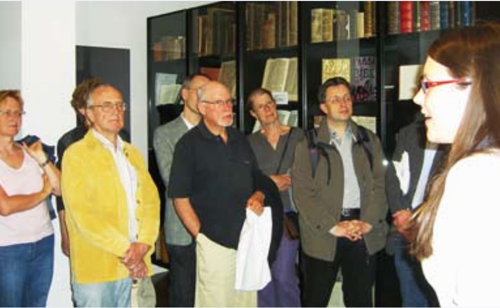
Besucherandrang im Bibelzentrum in der «Langen Nacht der Kirchen»

Aus der vielfältigen laufenden bibelmissionarischen Arbeit in Österreich – im Wiener Bibelzentrum und im ganzen Land!