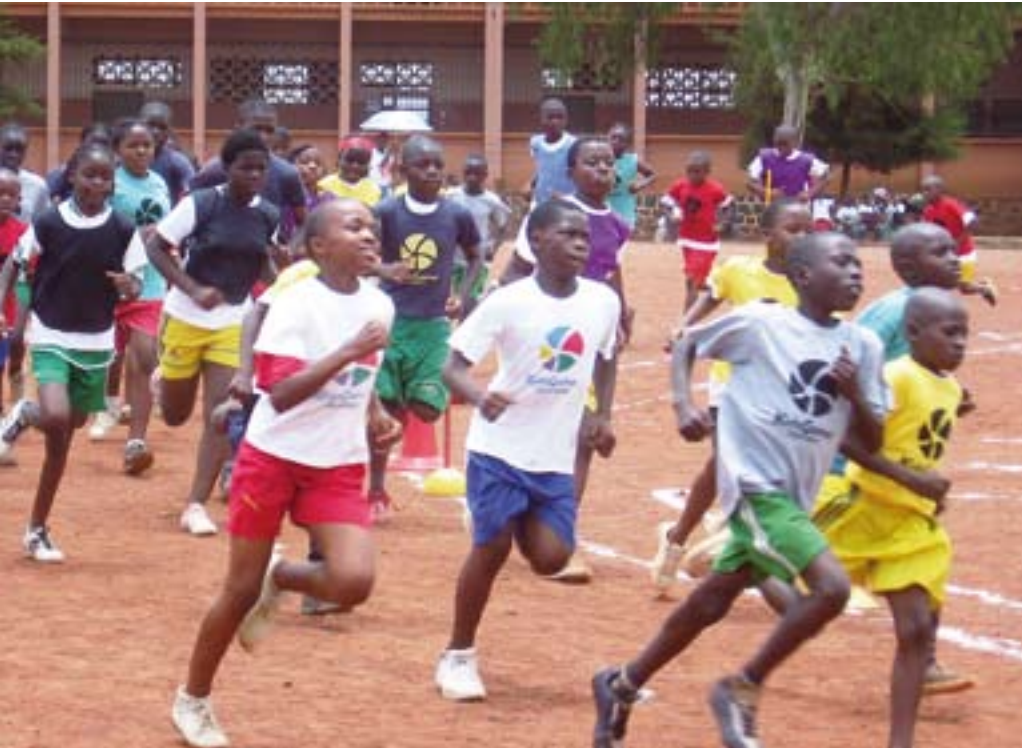
Mit Begeisterung dabei: «Kids Games» in Kamerun.

... in allen Erdteilen durch die Arbeit der Bibelgesellschaften: Neue Bibelübersetzungen, Broschüren mit Bibelworten, Seminare und Veranstaltungen, Angebote für junge Menschen und solche in schwierigen Situationen!