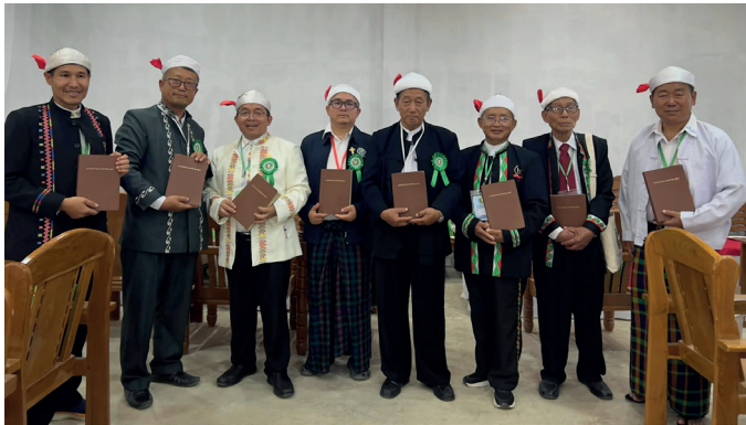
In traditioneller Tracht feiern die Christen die Fertigstellung der Bibel in Zaiwa.

Ein Mitarbeiter der Bibelgesellschaft sagt: „Wir preisen Gott für seine Gnade. Dank seiner Führung konnten wir die Bibelübersetzung in Zaiwa erfolgreich abschließen. Dank seiner Unterstützung und Bewahrung konnten wir diese Aufgabe trotz vieler Herausforderungen gut erfüllen.“