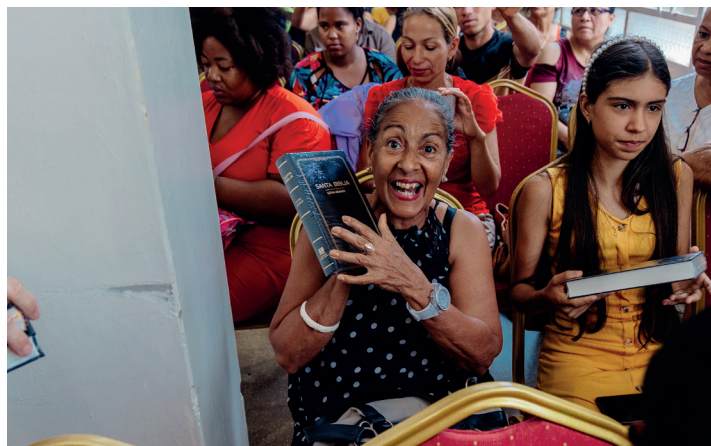
Die Christen in Kuba freuen sich über die lang ersehnten Bibeln.

Caridads Gemeinde ist kein Einzelfall. In ganz Kuba sind die Menschen auf der Suche nach Hoffnung – und finden sie im christlichen Glauben. Es gibt bereits über 50.000 Hauskirchen und kontinuierlich kommen neue hinzu.